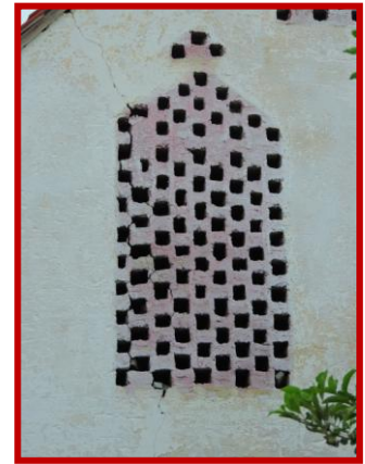
Graz, Engelsdorferstraße 41