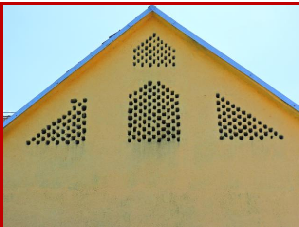
Imeno - Slowenien