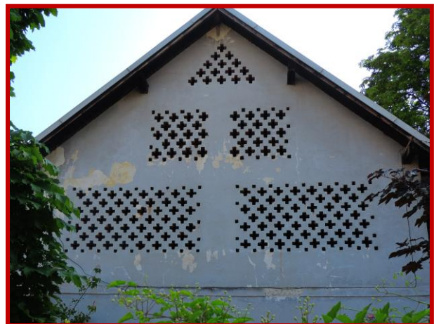
Lesce - Slowenien