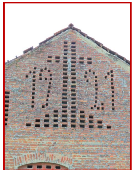
Banovice - Slowenien

Es gibt viele Variationen von Stadelfenstern - sie sind schier unendlich.