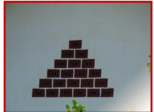
Zwischen Kranj und Skofja Lok - Slowenien